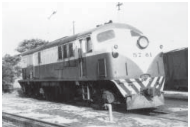
Unidad: 5781 Usuario: Lugar: Galpón Tapiales Situación actual: Desguazada Autor: Charlie Pérez Darnaud