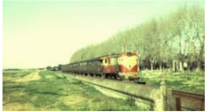
Unidad: 5789 Usuario: Lugar: Por la línea CC con destino a Villa Rosa Situación actual: Desguazada