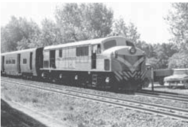
Unidad: 5792 Usuario: Lugar: En servicio local por lalínea CC Situación actual: Desguazada