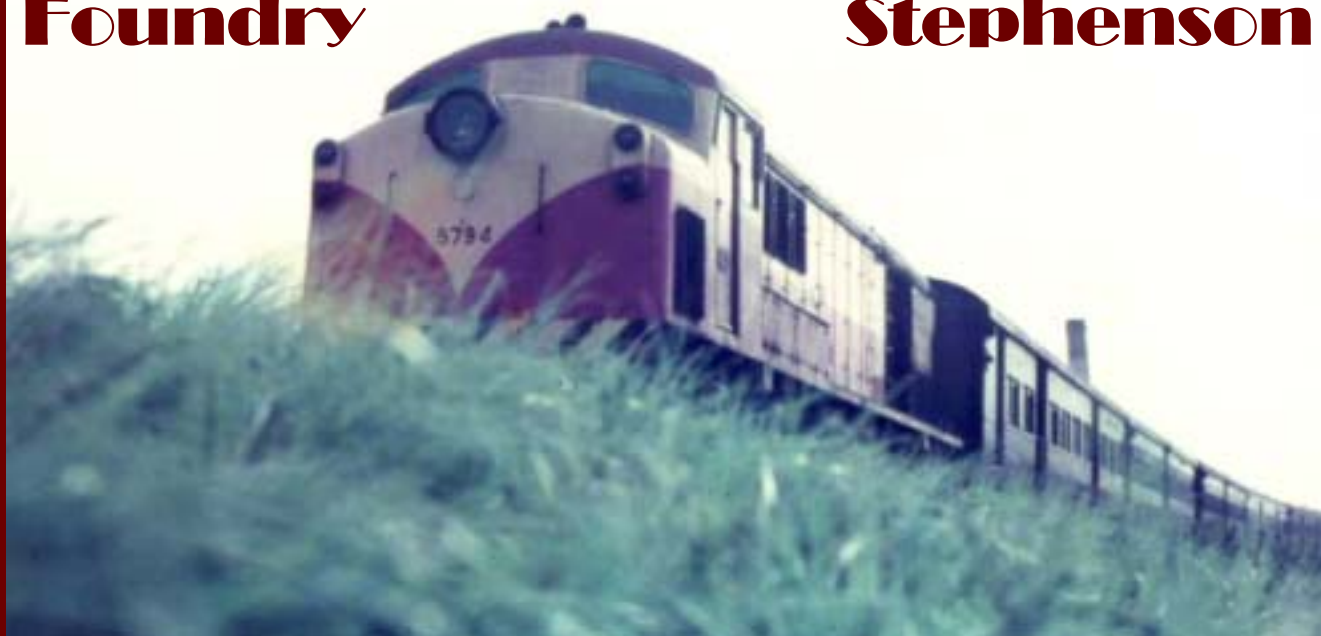
2º serie Robert Stephenson