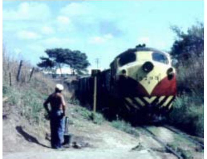
Unidad: 5795 Usuario: Lugar: En estación Kilo 12.600 rumbo a Pte. Alsina Situación actual: Desguazada Autor: ???