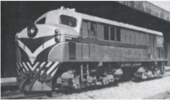
Unidad: 5796 Usuario: Lugar: Estación Retiro Belgrano Situación actual: Radiada Autor: Jorge González López