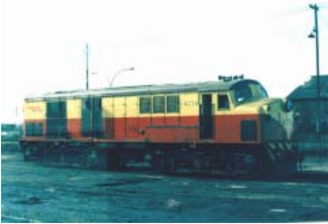
Unidad: 5776 Usuario: Lugar: Galpón Tapiales Situación actual: Radiada Autor: Charlie Pérez Darnaud