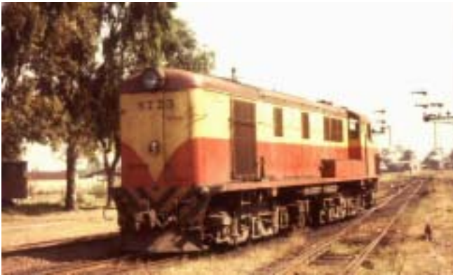
Unidad: 5773 Usuario: Lugar: Estación Buenos Aires Situación actual: Radiada ( Renúmerada 5795 2 )