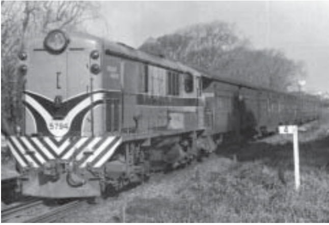
Unidad: 5794 Usuario: Lugar: Por la línea CC kilómetro 4 Situación actual: Desguazada Autor: ???