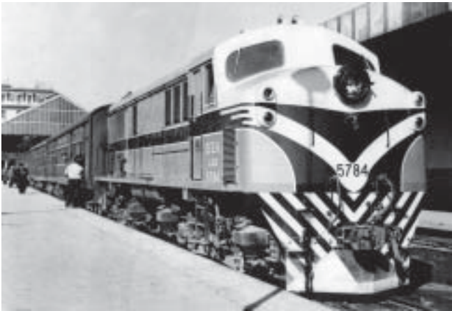
Unidad: 5784 Usuario: Lugar: Estación Retiro Belgrano Situación actual: Reparación suspendida RN 5778 2 Autor: English Electric