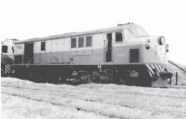
Unidad: 5782 Usuario: Lugar: Galpón Tapiales Situación actual: Radiada Autor: Jorge Gonzalez López