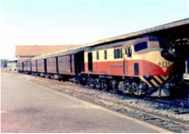
Unidad: 5771 Usuario: Lugar: Estación Buenos Aires Situación actual: Desguazada