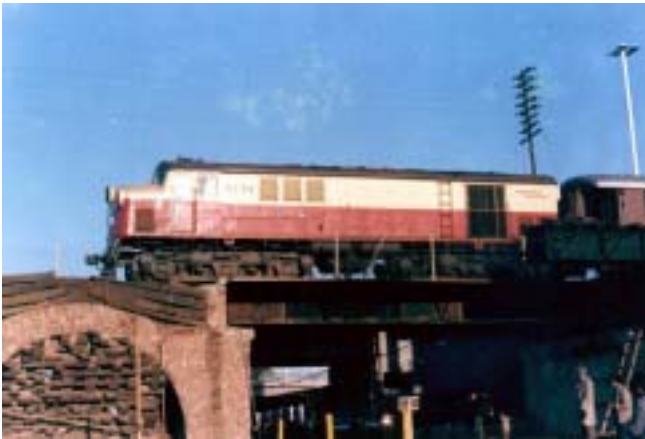
Unidad: 5778 Usuario: Lugar: Estación Kilo 16 Situación actual: Radiada Autor: Charlie Pérez Darnaud