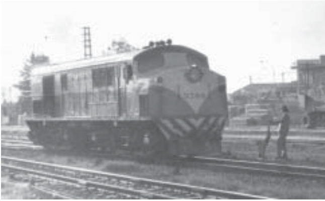
Unidad: 5788 Usuario: Lugar: Playa Villa Rosa Situación actual: Desguazada