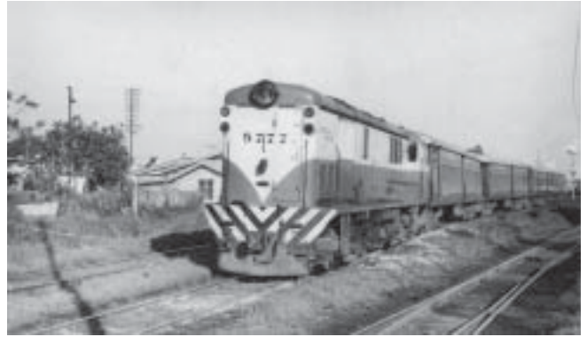
Unidad: 5777 Usuario: Lugar: Estación Tapiales Situación actual: Desguazada