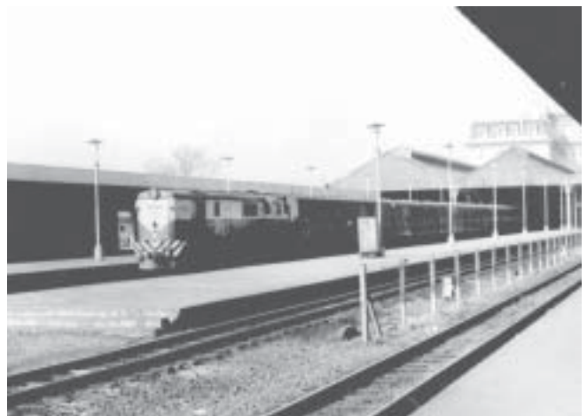
Unidad: 5793 Usuario: Lugar: Estación Retiro Belgrano Situación actual: Radiada