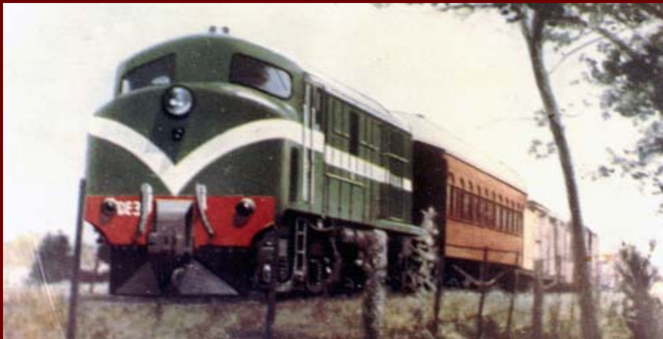
1º Serie Vulcan Foundry