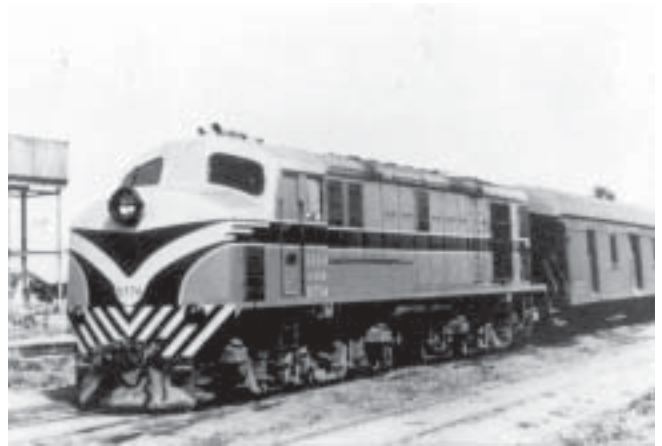
Unidad: 5774 Usuario: Lugar: Estación Buenos Aires Situación actual: Desguazada