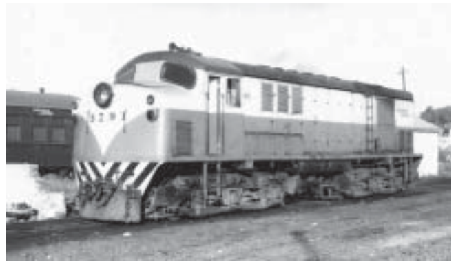
Unidad: 5791 Usuario: Lugar: Playa Tapiales Situación actual: Radiada