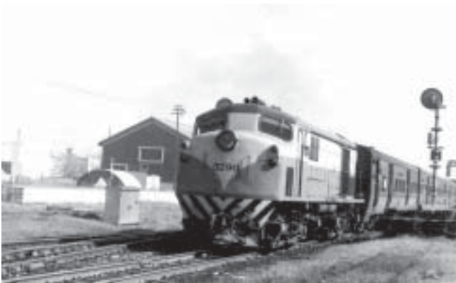
Unidad: 5790 Usuario: Lugar: Estación Boulogne Situación actual: Radiada