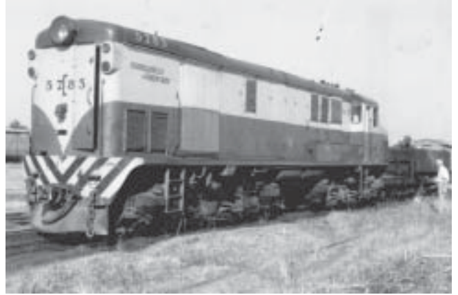
Unidad: 5783 Usuario: Lugar: Playa Tapiales Situación actual: Desguazada