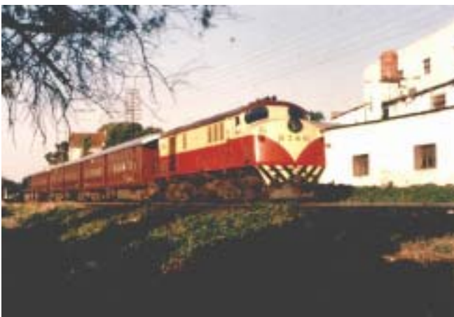
Unidad: 5786 Usuario: Lugar: Villa Lugano Situación actual: Radiada