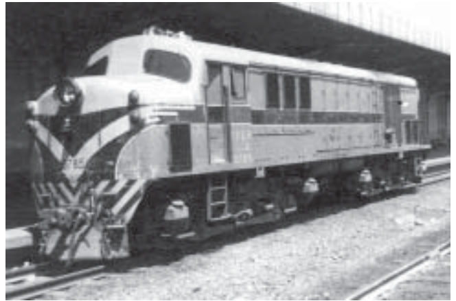
Unidad: 5785 Usuario: Lugar: Estación Retiro Belgrano Situación actual: Desguazada