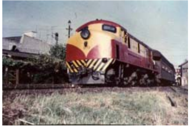
Unidad: 5772 Usuario: Lugar: Saliendo de Saenz Situación actual: Desguazada Autor: ??