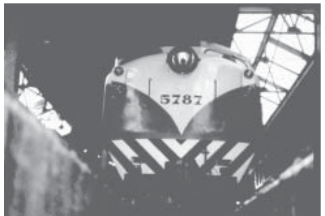
Unidad: 5787 Usuario: Lugar: Galpón Boulogne Situación actual: Desguazada