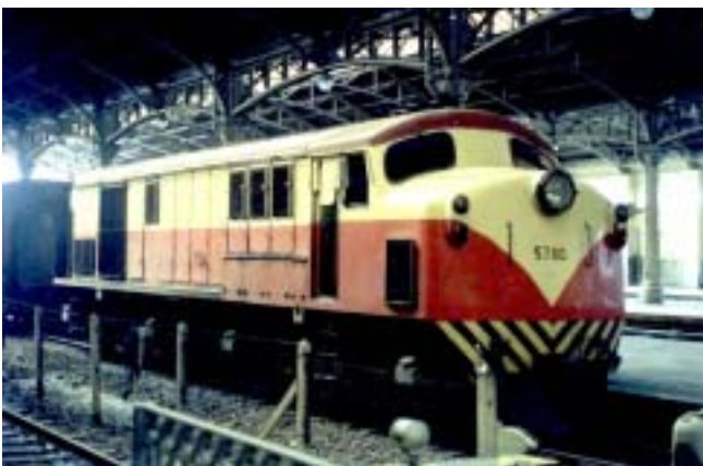
Unidad: 5780 Usuario: Lugar: Estación Retiro Belgrano Situación actual: Desguazada